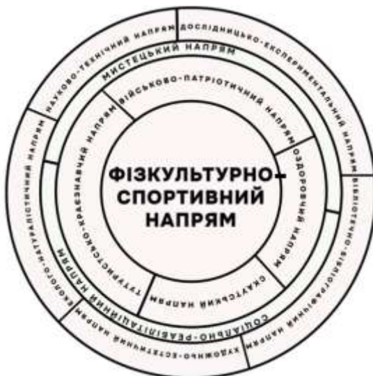
Рис. 4. Рівні взаємозв'язку фізкультурно-спортивного напрямку з іншими напрямками

Реалізація освітнього процесу в закладах позашкільної освіти здійснюється на основі типових освітніх програм, які затверджуються Міністерством освіти України та іншими органами виконавчої влади, у сфері позашкільної освіти.