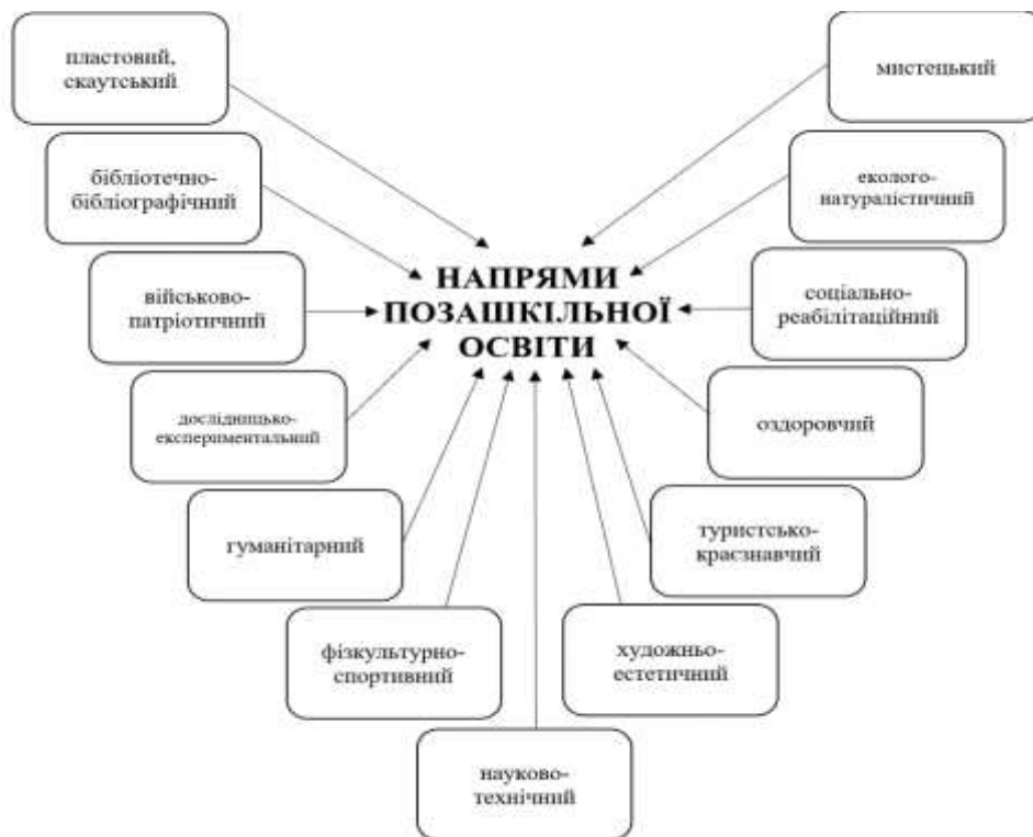
Рис. 3. Напрямки позашкільної освіти

Сьогодні початкова освіта представлена 13-ма напрямками, які висвітлені на рис. 3. Цікавим у межах нашої тематики є напрямок фізкультурно-спортивної роботи, спрямований на забезпечення фізичної підготовки, фізичного розвитку, фізичного виховання дітей, а також їх оздоровлення, загартовування, рекреацію, формування та вдосконалення навичок здоров'я та здорового способу життя, тісно пов'язаний з іншими напрямками: скаутський рух, військово-патріотичний, оздоровчий напрямок, туристично-краєзнавчий та інші (рис. 4).