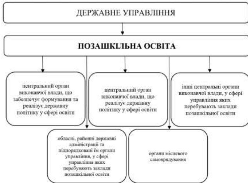
Рис. 2. Органи управління позашкільною освітою

Сьогодні початкова освіта представлена 13-ма напрямками, які висвітлені на рис. 3. Цікавим у межах нашої тематики є напрямок фізкультурно-спортивної роботи, спрямований на забезпечення фізичної підготовки, фізичного розвитку, фізичного виховання дітей, а також їх оздоровлення, загартовування, рекреацію, формування та вдосконалення навичок здоров'я та здорового способу життя, тісно пов'язаний з іншими напрямками: скаутський рух, військово-патріотичний, оздоровчий напрямок, туристично-краєзнавчий та інші (рис. 4).