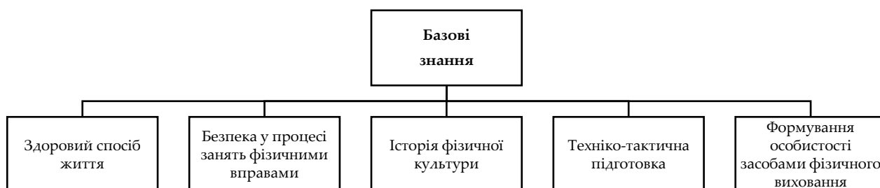
Рис. 3. Базові знання фізкультурної освітньої галузі

Базові знання, які необхідні учням 5–9 класів для опанування фізкультурної освітньої галузі, представлені на рис. 3.