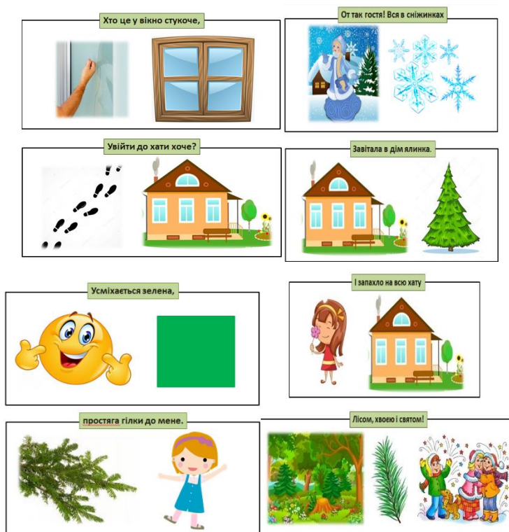
Рис. 1. Робота з мнемокартами

професійної підготовки буде розроблення здобувачами освіти мнемокарт до пальчикової гімнастики (проводять перед безпосереднім конструюванням виробу), художньо-літературного супроводу художньо-конструктивної діяльності. Наприклад, під час моделювання заняття з художньої праці на тему «Ялинка», здобувачка Юлія безпосередньо перед виготовленням новорічної ялинки з конусів та ниток сконструювала, продемонструвала та змодельовала в умовах навчальної аудиторії роботу з мнемокартами (рис. 1).